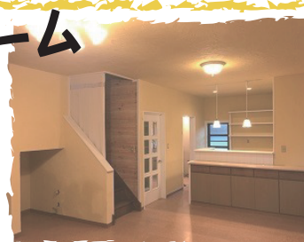
施工例：自治医大グリーンタウン 漆喰壁&コルクフローリング重ね張り 照明+窓枠塗装