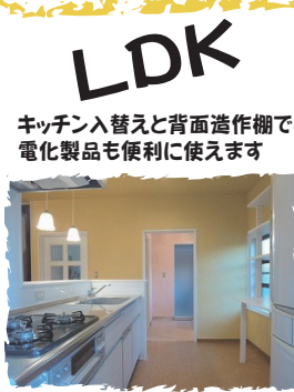
LDK キッチン入替と背面造作棚で、 電化製品も便利に使えます