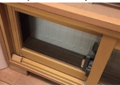
野木ロースタイル