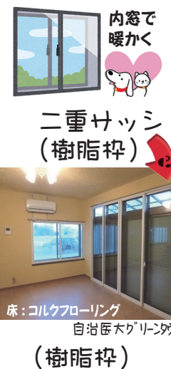
内窓で暖かく 二重サッシ (樹脂枠) 床：コルクフローリング 自治医大グリーンタウン (樹脂枠)